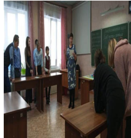
Лингвистическая игра «Слов русских золотая роспись»