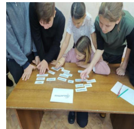
Интеллектуальный марафон «Бесстрашен ты, Великий Петр»