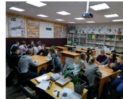
Игра «Семь самых известных реформ Петра I».