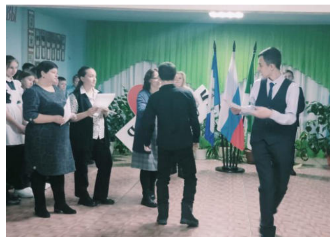
Подведение итогов недели