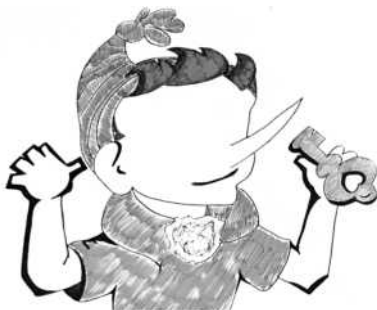
Рис. П2.3. Пример «Буратино»