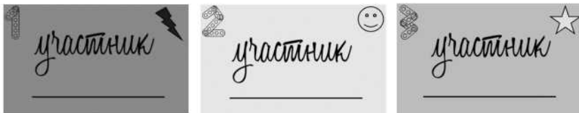
Рис. П2.1. Пример карточек участника. Цифры, фигуры и цвет карточек меняются между собой для разделения участников по разным командам все три этапа